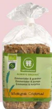
Knas Knækbrød med emmentaler og græskar- kerner, Urtekrum, 200 g, 26 kr.