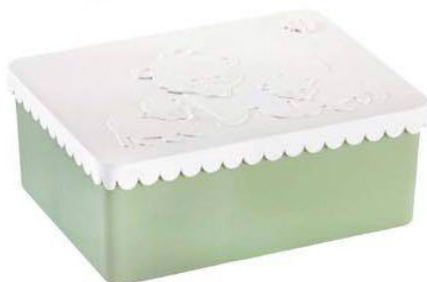
Til de mindste Madkasse, Blafre, h 7,3 x b 18,8 x l 13,2 cm, 149 kr.