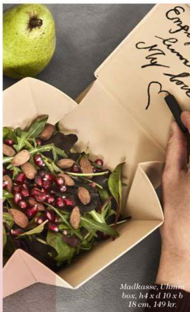
Madkasse, Uhmim box, h 4 x l 10 x b 18 cm, 149 kr.