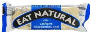
Naturligt Frukt- og nøddebar, Eat Natural, 45 g, 16 kr.