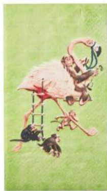
Fine flamingøer Frokostservietter, Rice, 40 x 33 cm, 35 kr.

Hverdagen er i fuld gang igen, og madpakken er tilbage på to-do-listen. Heldigvis er der masser inspiration at hente og snack-nyheder at supplere rugbrødsammerne med.