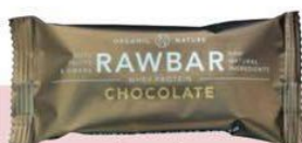
Råt er godt Rawbar med chokolade. Organic Nature, 50 g, 22 kr.